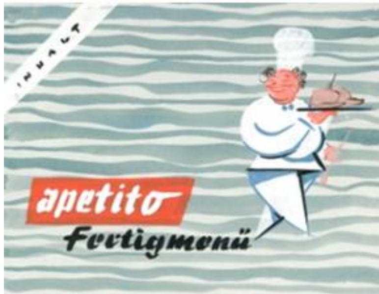
Apetito Fertigmenü 1958