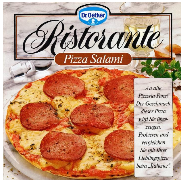
Dr. Oetker Ristorante Salami 985