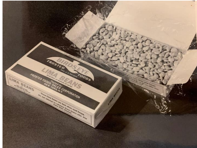
“Birds Eye” TK-Bohnen