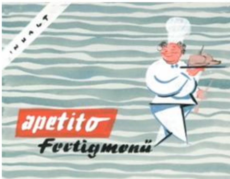
Apetito Fertighmenü 1958