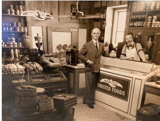
Clarence Birdseye