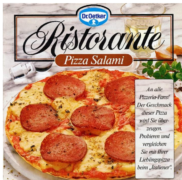
Dr. Oetker Ristorante Salami 985