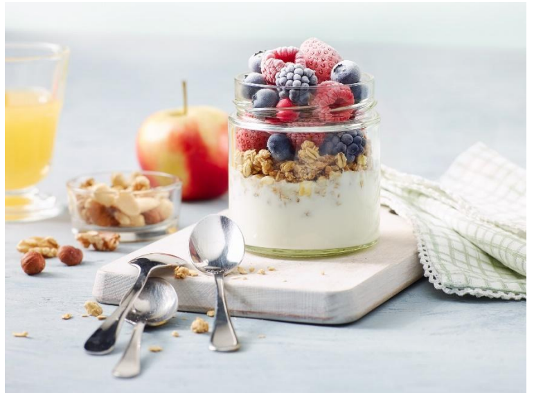
Overnight Oats mit Tiefkühl-Himbeeren