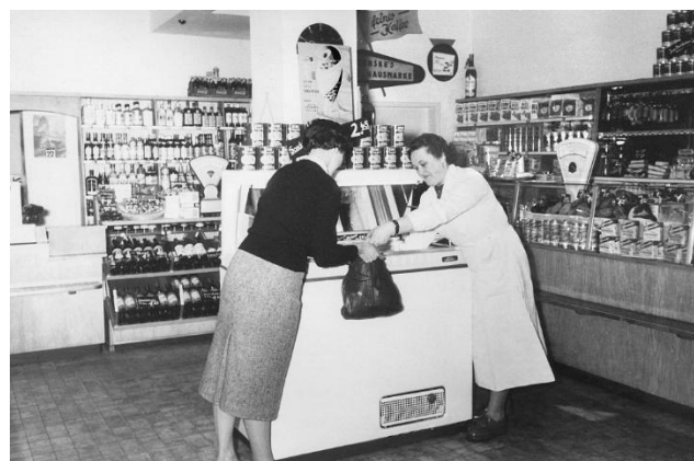
Verkaufssituation TK-Truhe