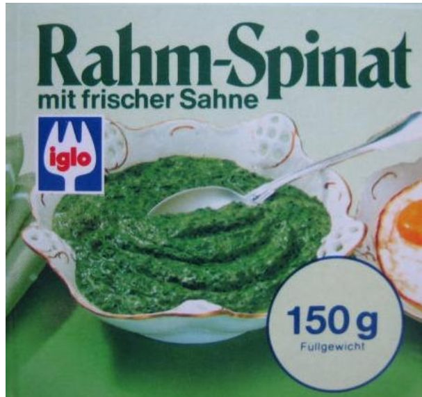
Iglo Rahm-Spinat 1979 (Fotovermerk: iglo Deutschland)