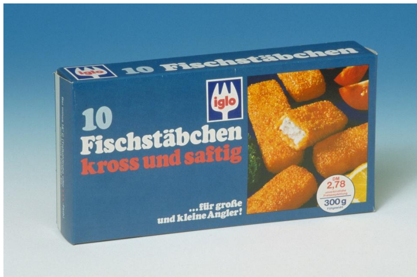
Iglo Fischstäbchen 80er