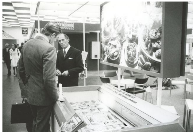
anuga 1955